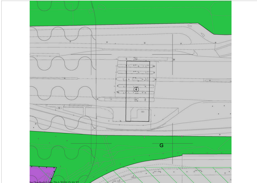
fragment geldende bestemmingsplan

Voor het plangebied geldt het bestemmingsplan "Dordtse Kil", vastgesteld op 24 juni 2013. Er geldt de bestemming "Verkeer" met een bouwvlak op de huidige bestaande bebouwing en een maximale bouwhoogte van 6 meter.