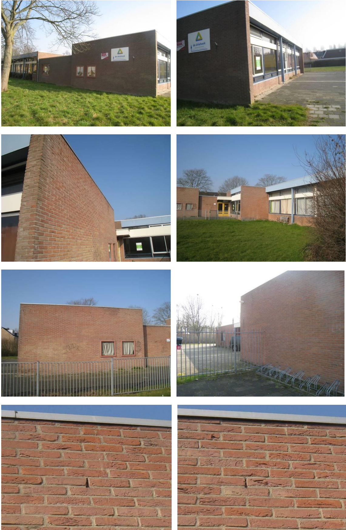
Figuur 2. Aanzicht van Nijverheidsstraat 95 te Dordrecht.